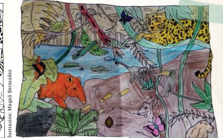
Ilustración del bioma del bosque atlántico para colorear.