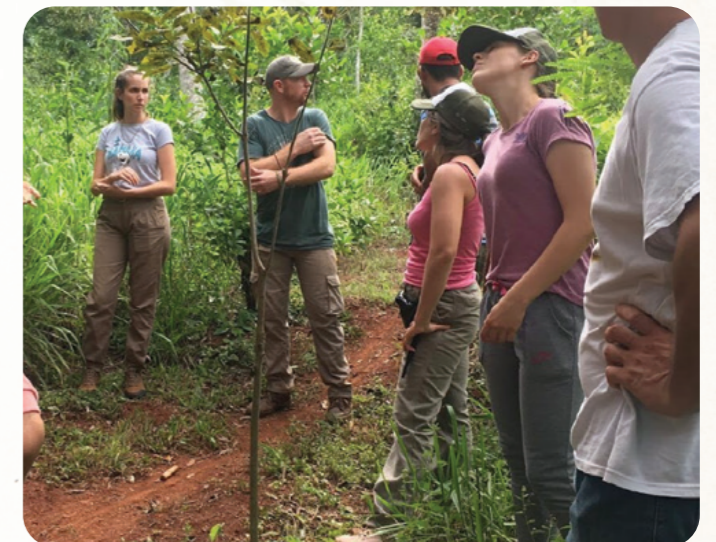
Visita de estudiantes de la Facultad de Ciencias Forestales de la UNaM.

100 personas desde diciembre 2021 a la actualidad